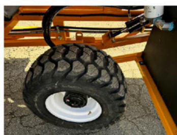
Самоходный наземный привод